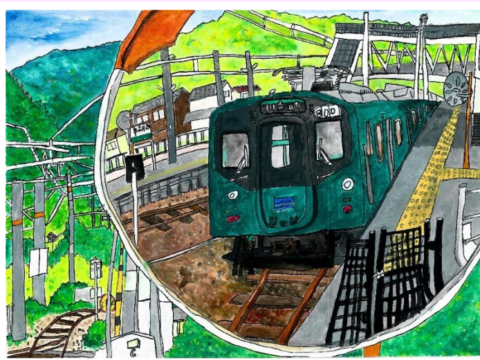
令和6年度大賞「鏡の中の加古川線」