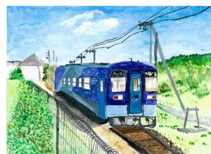
令和6年度北条鉄道賞 「あびき駅からの風景」