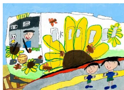
令和6年度粟生線賞 「ぼくのだいすきな ひまわりでんしゃ」