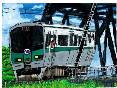
令和6年度加古川線賞 「加古川こえて谷川へ」