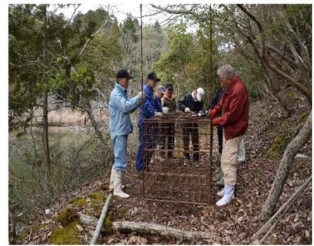
集落による捕獲活動

また、カワウによるアユの食害を防ぐため、カワウ被害対策協議会を開催し、捕獲技術の向上と広域的捕獲体制の構築を図ります。