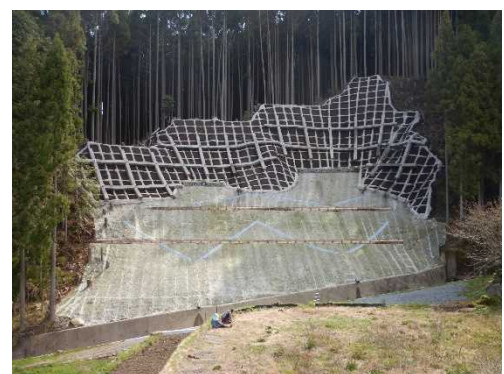
山腹工(宍粟市一宮町福知)

特に、ため池は決壊により人家等に被害を及ぼす可能性があるため、「定期点検」によりため池の状況を把握し、ため池管理者、市町と協力して決壊の未然防止・減災対策を実施します。