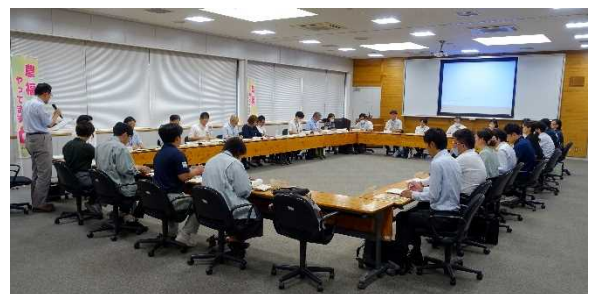
西播磨地域農福連携推進会議

この賑わいを持続的なものとするため、名物料理や特産品を開発・提供するとともに、地域が連携して魅力を発信するよう努めます。