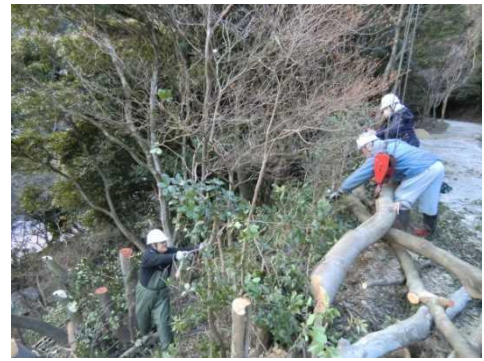
ボランティアによる里山林整備 (赤穂市)

森林を県民共通の財産と位置づけ、里山林の再生を進め、森林の持つ多面的機能の高度発揮を図り、地縁団体、NPO法人、ボランティア団体、企業など多様な担い手による森づくり活動を進め、森林が有する多面的機能の維持向上を図ります。