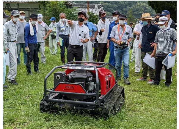
ラジコン草刈り機の実演会 (上郡町)

特に農業では、施設園芸で環境制御技術や、土地利用型にはドローンによるセンシング技術や自動操舵システム、高性能草刈機等の導入を図るとともに、自動水管理システム等の実証等を行い、西播磨地域の営農条件に適合したスマート農業技術を確立します。