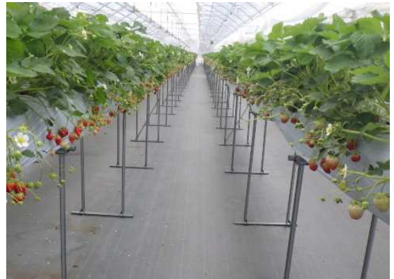
いちご観光農園 (相生市)

養鶏は、採卵鶏の飼育数が県下の43%を占める県下一の産地となっており、小規模の養鶏農家では、直販割合の向上や差別化戦略