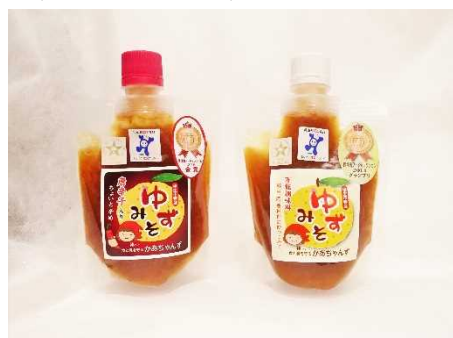
相生市産ゆずを使ったひょうご認証食品

また、より効果的にリスク管理できる貝毒監視体制の整備や、貝毒原因プランクトンの発生動向の把握等による、養殖のリスク低減手法を検討します。