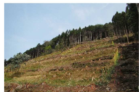
針広混交林事業による広葉樹植栽

手入れ不足のスギ・ヒノキ林の間伐・作業道開設を、森林環境譲与税など公的支援により進め、森林の適正管理を計画的に推進し、水源かん養機能や土砂災害防止機能等の向上を図るとともに、市町を対象とした「ひょうご森づくりサポートセンター」の技術的支援を活用し、奥地等の条件不利地の森林整備など取組を推進します。危険溪流流域の森林や集落裏山の防災機能の強化のため、災害緩衝林や間伐木を利用した土留