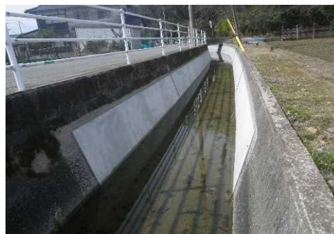
補修した水路（赤穂市）

老朽化している井堰や揚排水機場、用排水路等の農業用水利施設については、施設毎に機能診断と機能保全計画の策定を行い、全面更新が必要となる前にストックマネジメント手法*を用いた予防的な工事を行うことで、ライフサイクルコスト**の低減と施設の長寿命化を図ります。