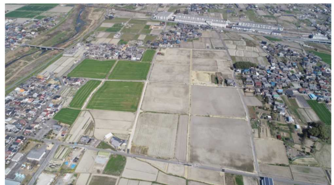
経営体育成ほ場整備事業(太子町)