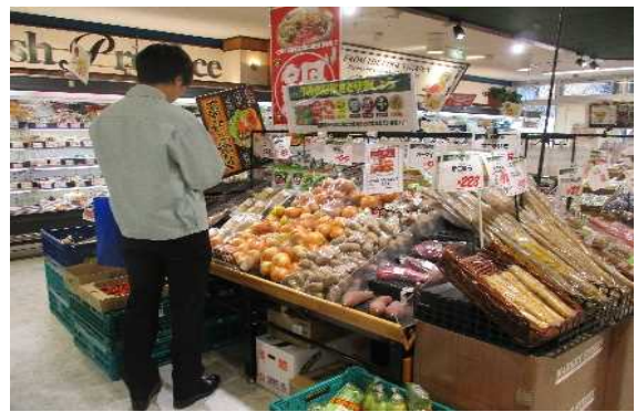
食品表示の巡回調査

あわせて、新たな加工品や名物料理の開発や販売促進イベント、漁協女性部による魚食普及への取組など、地域産農林水産物の持つ魅力を発揮する取組を支援します。