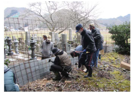
集落での防護柵の維持管理