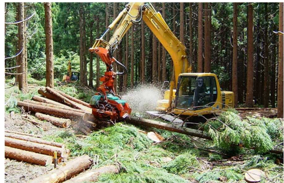
高性能林業機械による造材作業 (宍粟市一宮町)

森林は、木材生産の場だけではなく、土砂災害、洪水の防止、水源のかん養などの公益的機能を有し、県民からの多様な要請があります。そのため、森林を県民共通の財産と位置づけ、森林の持つ多面的機能を高度に発揮させる「新ひょうごの森づくり」や防災機能の強化を図る「災害に強い森づくり」、保安林制度等の適正な運用による森林の保全管理を行い、山地防災・土砂災害対策のさらなる推進を図る必要があります。