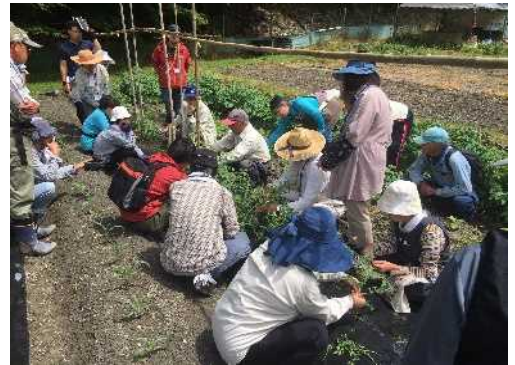
「地域楽農生活センター」の栽培講座 （佐用町）

地域の元気の中心になることを目的として佐用町が出資して設立された「株式会社元気工房さよう」を西播磨地域の「地域楽農生活センター」として位置づけ、地域農業の担い手育成の場としての技術指導等を支援するとともに、兵庫楽農生活センターとの連携のもと、楽農生活に係る情報発信や農業体験イベント、栽培講座などによる「農」の学びや体験の場の拠点とすることで、地域の楽農生活を発展・深化させるためのサポート体制の構築を図ります。