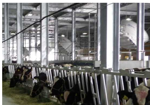
暑熱対策を施した新築畜舎 (赤穂市)

また、神戸ビーフの素牛となる但馬牛の増頭や、「但馬牛肥育マニュアル」に基づいた飼養管理技術の改善による神戸ビーフ認定率の向上をめざします。