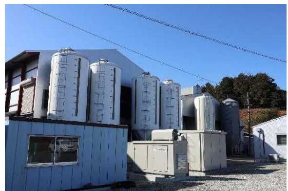
JGAP 認証を取得した農場の新鶏舎 (上郡町)