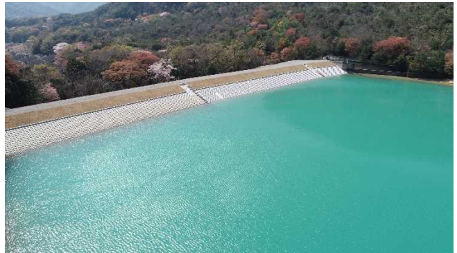
ため池改修（赤穂市湯の内池）

治山ダムなどの必要な施設の計画的な整備や、山腹崩壊対策を推進し、自然災害への的確な対応と地域防災力の向上を図ります。