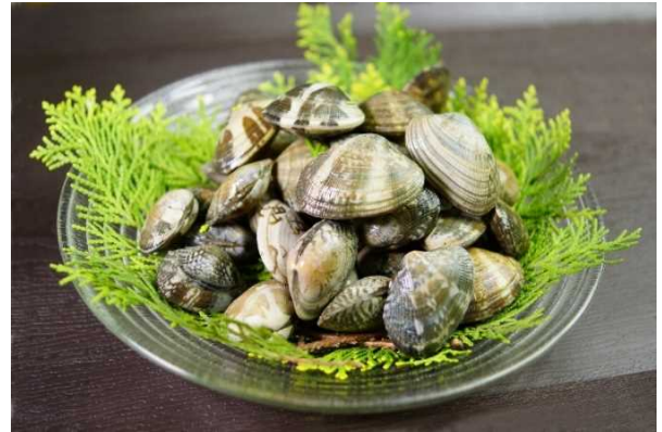
県産種苗を用いたアサリ

さらに、持続的な漁業の実現のため、収益性の向上と適切な資源管理の両立に向けた取組や複合経営をめざす漁業者等に対し、漁船やエンジン・漁具等をリースして、沿岸漁業の収益性の向上を図ります。