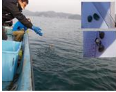
種苗放流（サザエ・アワビ）