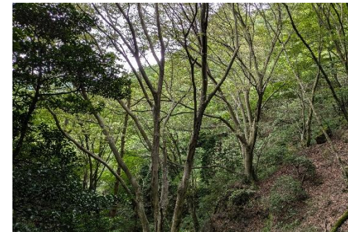
気候変動により冷温帯林であるブナ林の生息適地の縮小が懸念