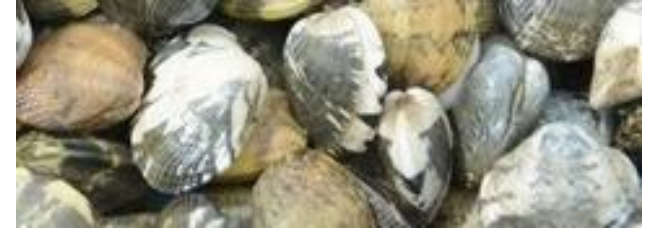
個体によって模様が違うアサリ