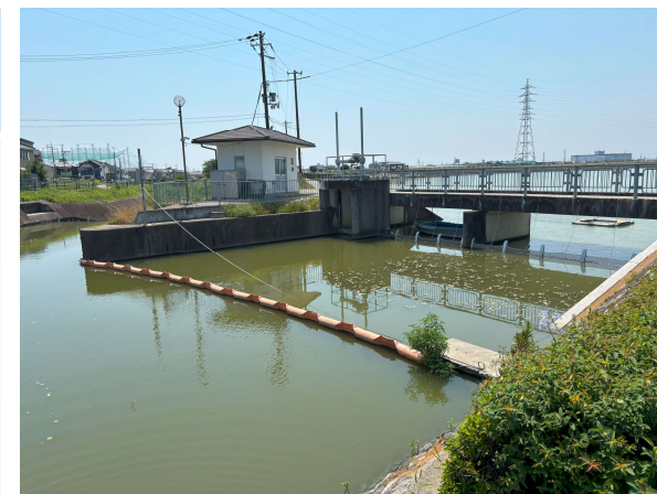
オイルフェンス設置例