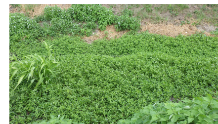
西脇市内の繁茂状況