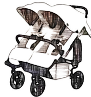
2人乗せベビーカー