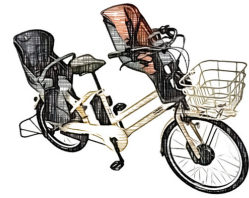
子ども2人乗せ自転車