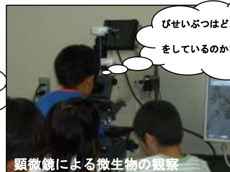
顕微鏡による微生物の観察