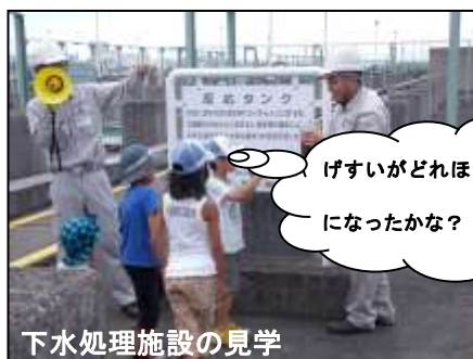
下水処理施設の見学