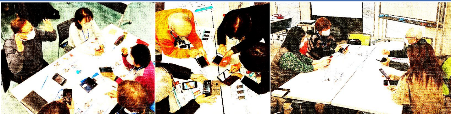
↑令和4年度の講座の様子