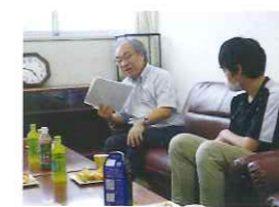
大学校長との懇談