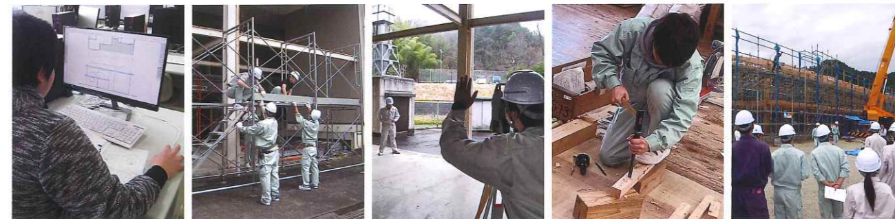
建築CAD 建築施工実習 測量実習 大工技能実習 現場見学