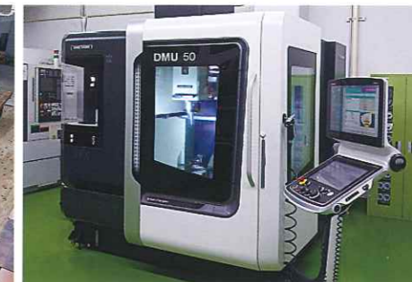
5軸マシニングセンタ