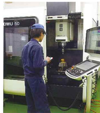
5軸マシニングセンタ