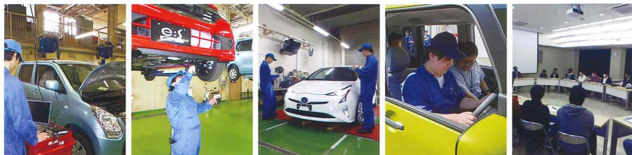
OBDによる診断 整備実習 検査実習 新技術講習会 外部講師による特別授業