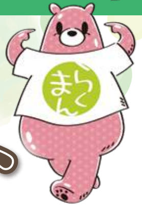
兵庫県老人福祉事業協会 キャラクター