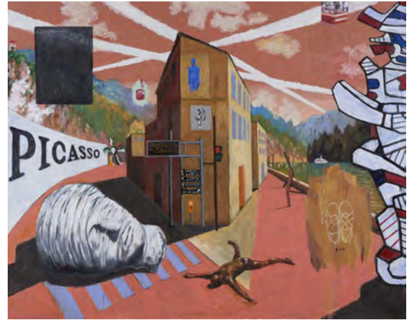
64 At Box Roots 2016 油彩・布 181.8×227.3cm 彫刻の森美術館(公益財団法人 彫刻の森芸術文化財団) 蔵

《At Box Roots》は 2016 年に箱根彫刻の森美術館で開催された「横尾忠則 迷画感応術」展のために描き下ろされた作品で、タイトルは「箱根にて」を英単語に直訳風に置き換えたものです。箱根町内の Y 字路風景に、彫刻の森美術館のコレクション（ジャン・デュビュッフェ、アントニー・ゴームリー、イヴ・クライン、三木富雄、フェルナン・レジェ、イゴール・ミトライ）やピカソ館が描き込まれています。この作品が描かれた直前、横尾は家のなかで転倒して右足小指のつけ根側面を骨折、約 1 ヶ月間入院しました。その際に履いていた治療用の靴が、画面右下にドロイーイングされています。