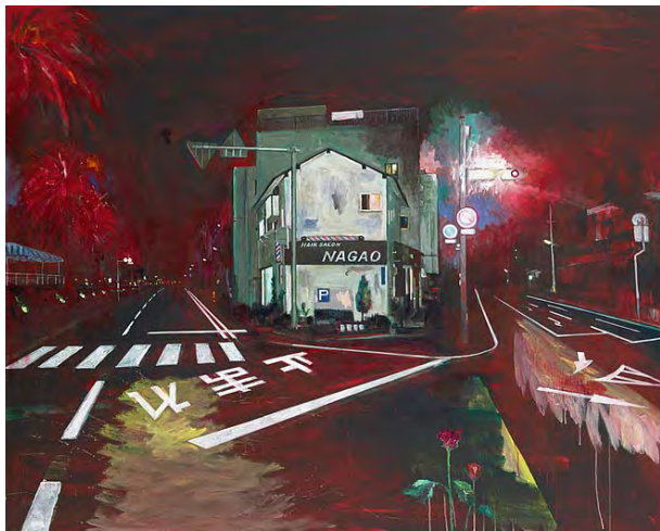
55 宮崎の夜 - 台風前夜 2004 アクリル・布 181.6×228.0cm 作家蔵

これ以降横尾は、それまで以上に積極的に公開制作を行うようになりました。その一因は、Y字路というモチーフが、公開制作と親和性が高いことにあるでしょう。写真を見ながら描くこと、および最初の手順がほぼパターン化している(左右に分かれた道路奥の消失点をまず決定することから、躊躇なく描き始めることができる)ことから、躊躇なく描き始めることができるのです。また中央に配された建物と、左右奥へと伸びる道路から生まれる放射状の線により、構図の安定性が担保されることも見逃せません。土台となる造形が堅牢なため、即興的に雑多な要素を描き足しても画面は破綻しにくいのです。