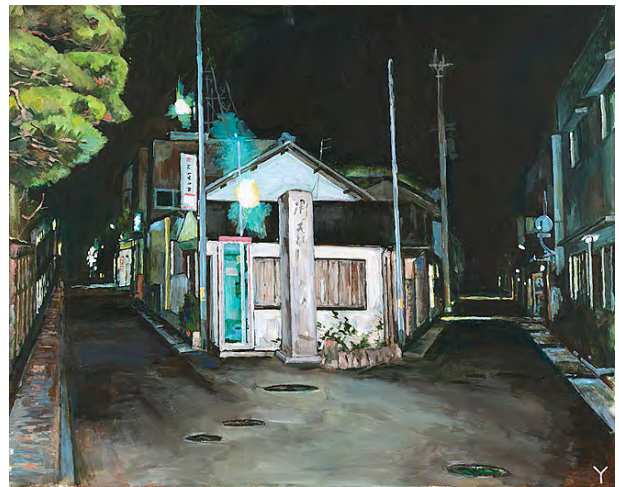
2 暗夜光路 N市-II 2000 アクリル・布 72.7×90.9cm 個人蔵(横尾忠則現代美術館寄託)