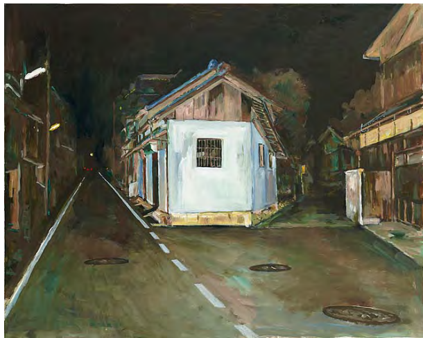
1 暗夜光路 N市-I 2000 アクリル・布 72.7×91.0cm 横尾忠則現代美術館蔵

西脇市岡之山美術館で2000年10月から開催された「横尾忠則西脇・記憶の光景展」のために、横尾は故郷の西脇に滞在し、のべ12日間で17点もの新作を描きました。この時の横尾の主要な関心は「夜の西脇」で、夜間に繰り返し取材に出かけています。かつての通学路である椿坂に、足繁く通った模型店の跡地がありました。思い出の場所をレンズ付きフィルム(インスタントカメラ)で撮影、現像したところ、思いがけない画像が現れます。ストロボの光が届く中央の建物は白飛びする一方、左右に別れた道は闇へと溶け込み、見慣れた景色がまるで異質な風景へと様変わりしていたのです。この写真からインスピレーションを得た横尾は、市内各所の夜のY字路を集中的に撮影し、絵画を連作しました。発表当初《ブラックホールN市》と題されていた作品群は、横尾にしては珍しく素直な写実が特徴的です。世紀の変わり目を迎え、故郷を介して自己の原点を見つめ直そうとしていた様子がかがえます。