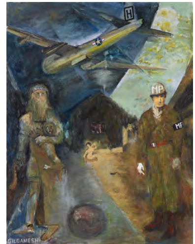
69 ギルガメッシュとMP 2019 油彩・布 145.5×112.0cm 作家蔵(横尾忠則現代美術館寄託)