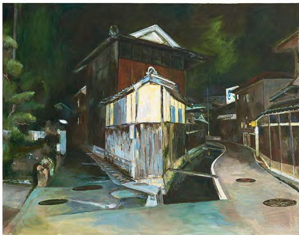
3 暗夜光路 N市-III 2000 アクリル・布 91.2×117.0cm 作家蔵(横尾忠則現代美術館寄託)