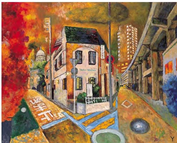
23 健全な感情 2002 油彩・布 130.3×162.1cm 東京ステーションギャラリー蔵