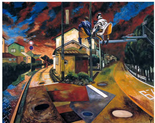
32 とりとめのない彷徨 2002 アクリル・布 181.8×227.3cm 作家蔵