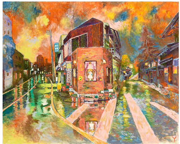
22 朱い水蒸気 2002 油彩・布 130.5×162.3cm 作家蔵(横尾忠則現代美術館寄託)