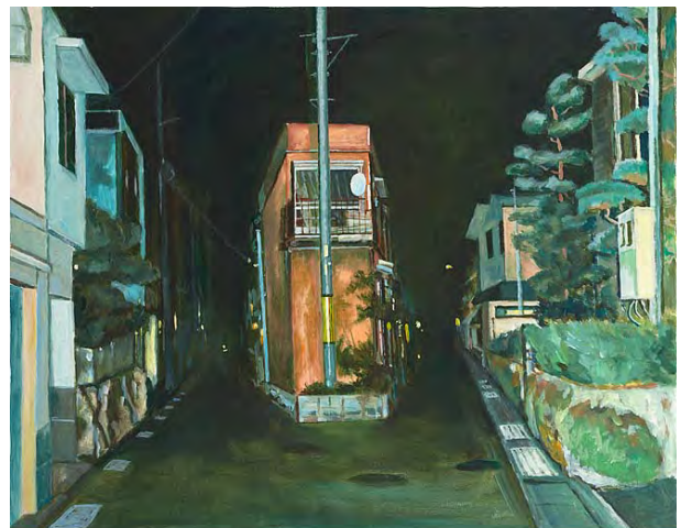
4 暗夜光路 N市-IV 2000 アクリル・布 73.1×91.4cm 作家蔵(横尾忠則現代美術館寄託)