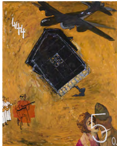
68 Last B29 2019 油彩・布 162.0×130.0cm 作家蔵(横尾忠則現代美術館寄託)