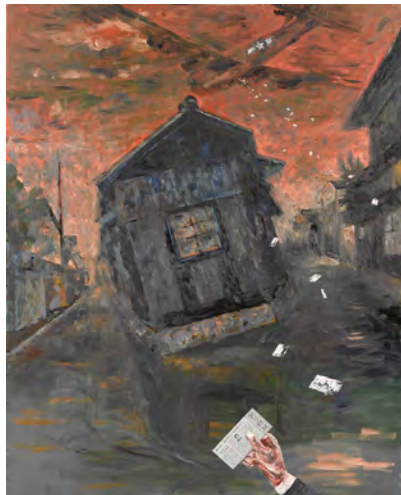
67 回転する家 2018 油彩・布 162.1×130.3cm 作家蔵(横尾忠則現代美術館寄託)

いずれも Y 字路シリーズの第 1 作《暗夜光路 N 市 -I》と同じ、西脇市内の椿坂がモチーフとなっていますが、必ず上空に B29 爆撃機が描かれるなど、戦争の記憶が反映されています。《回転する家》で傾き始めた中央の建物は、《Last B29》ではシルエットの女性にジャッキアップされ、さらに激しく傾いています。《ギルガメッシュと MP》では中央の建物は水平に戻っているものの、その前にはのんきに行水する女性が描かれ、左右に進駐軍 (MP) となぜかギルガメッシュが配置されています。唐突な古代メソポタミア王の登場は、夢のなかで突如「ギルガメッシュ」という言葉が啓示のように響いたことによるものです。目覚めてから調べたところ、ギルガメッシュはしばしば予知夢を見ていたことが分かりました。横尾自身も夢を重視し、しばしば作品に取り入れていることからギルガメッシュに親近感を抱いたのです。