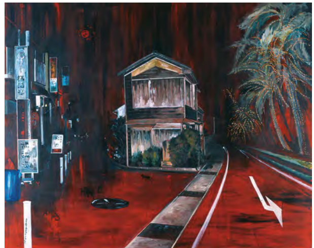
56 宮崎の夜 - 眠れない家 2004 アクリル・布 181.8×227.3cm 東京国立近代美術館蔵