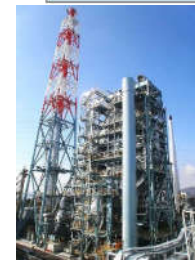
株式会社日本海水 赤穂バイオマス発電所