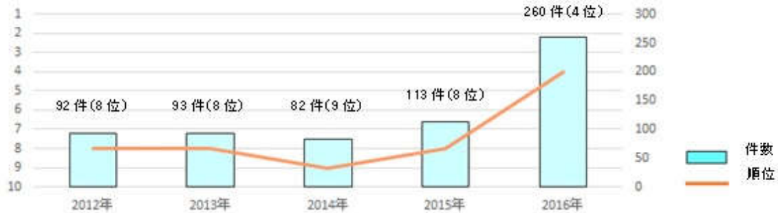
資料：神戸市における国際会議開催件数の推移