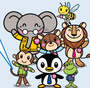
ひょうご仕事と生活センター キャラクター「WLB7」