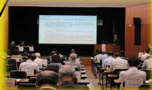
ワークショップひょうご2022

主催 独立行政法人 高齢・障害・求職者雇用支援機構 兵庫支部 共催 兵庫労働局・ハローワーク / 兵庫県 後援 神戸新聞社