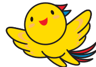
兵庫県マスコットはぼたん

兵庫県内で正社員として働きたい方を対象に 兵庫県内で正社員採用をしている企業とのマッチングを促進するプログラムです。 経験者を求める求人から未経験で応募できる求人等、様々な業種・職種の求人と出会うチャンスです。 新たな仕事にチャレンジしたい方の参加をお待ちしております。