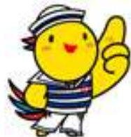
兵庫県マスコットはぼタン