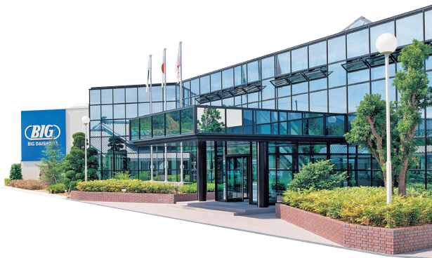
淡路島にある第2工場