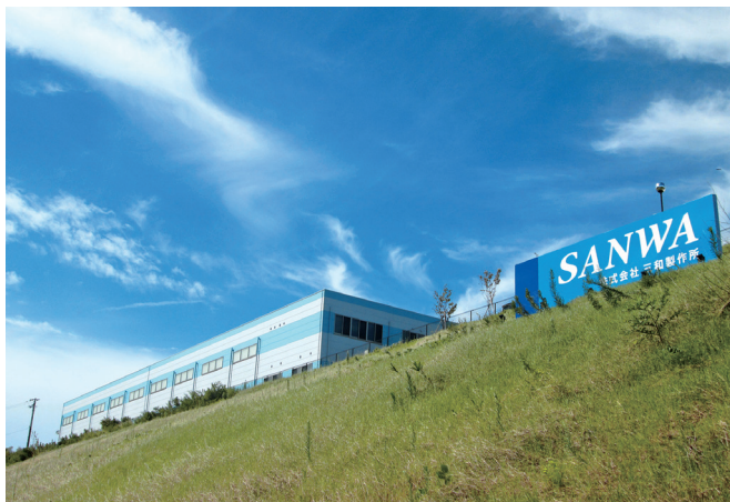
三和製作所 本社工場

淡路島のきらきら輝く海、青い空につつまれた最高の環境の中で、これから世に出る最先端のモノを私たちと一緒に作っていきましょう。