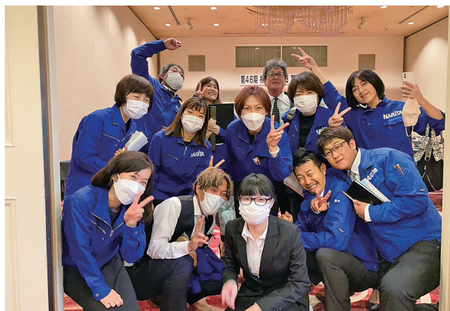
みんな楽しく働こう!! みんなおいて!!

仕事と生活のバランス企業表彰 ひょうご女性活躍推進企業(ミモザ企業) 子育て応援協定取得 健康経営優良法人'22・23認定 男女共同参画社会づくり協定