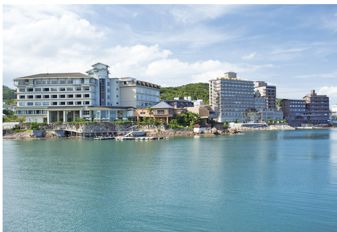
グループホテルがつながっているため湯めぐりし放題

また、淡路島には500室の社宅や事業所内保育所を準備し新卒の採用や育成に力を注ぎ各ホテルで若手スタッフを中心に活躍しております。調理部門では学びながら働くキッチンアカデミーを開設し調理人の育成にも力を注いでおります。