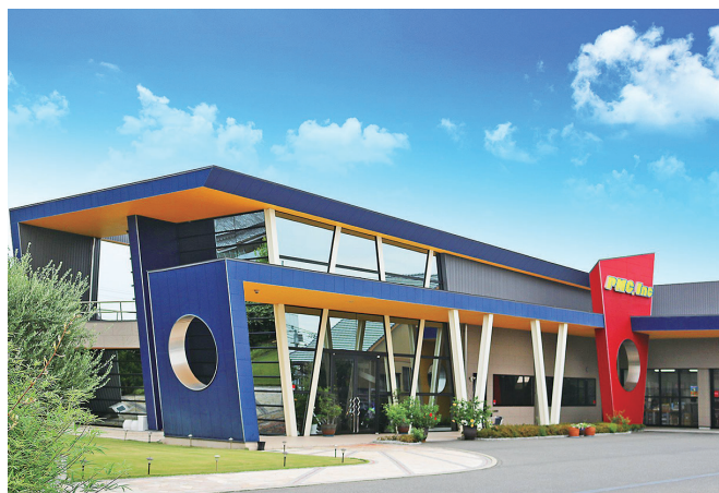
淡路島を拠点に日本全国、そして世界に高品質・高性能なバイクパーツを届けています