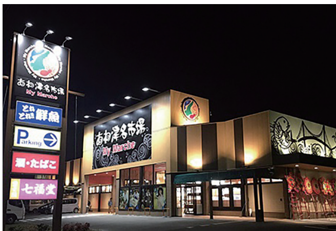
マイマルシェあわ津名市場

「淡路島の食生活をさらに豊かなものになりたい！」そんな思いでスタッフみんな元気に頑張っています。