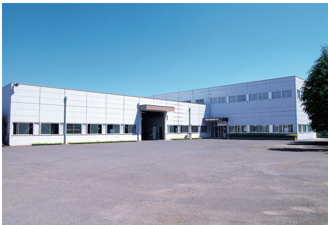
平成26年 一貫生産のため拡張した淡路工場

式に加え、電気、ガス、蒸気などを熱源とするエコ洗浄機をラインアップし、様々な業界で高評価を得ております。洲本製品への需要は今後ますます高まるものと考えられ、市場の期待に応えるよう一步一步着実にまい進してまいります。