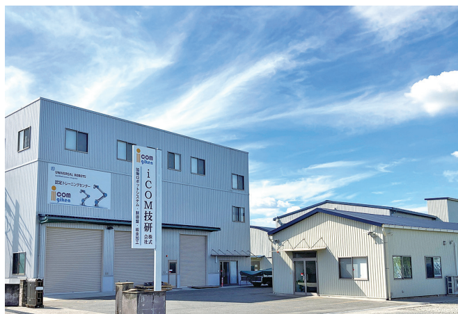
事業所、ユニバーサルロボット社認定トレーニングセンター

当社は制御盤事業（設計・製作・施工）や、板金事業（切断・曲げ・溶接）も展開しており、各事業の特色を活かして相乗効果を発揮し、今後も事業の拡大を目指していきます。