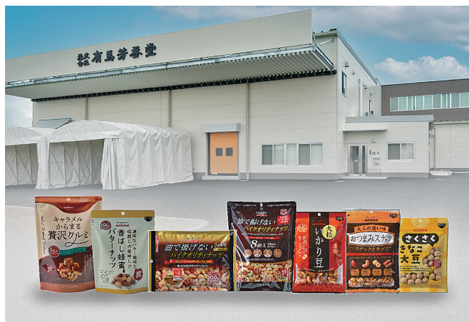
体にやさしい、こだわりのナッツ・豆菓子を稲美工場で製造しています

にやさしいモノづくりに取り組み、皆様に提供しています。従業員が一丸となり、みんなで一緒に考え、行動する会社を目指し、そしてこだわりのモノづくりで、オンリーワン、地域ナンバーワンへの挑戦を続けています。