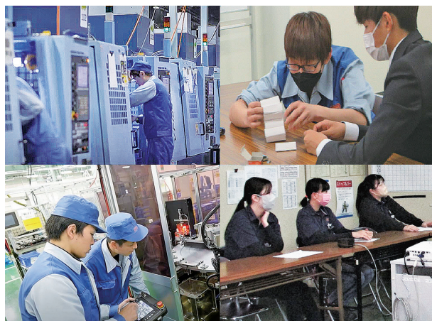
自社独自の技術開発

加工から熱処理、組立、性能検査まで全工程を社内でする一貫生産が当社の強みです。最新鋭の機械設備と長年のノウハウで多品種少量生産により様々なお客様のニーズにお応えしております。AIロボットと人間との協働に挑戦し続けます。