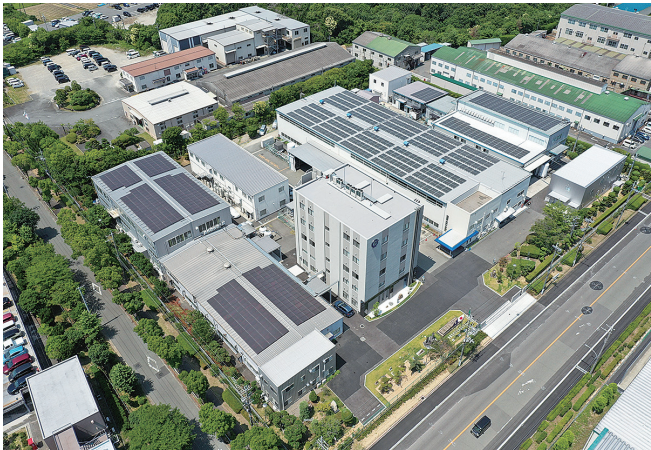
最先端設備を導入し続ける三木工場

なりました。そして今では、祖業である金属熱処理加工業に加え、金属射出成形（MIM）による製造業、3D積層造形による医療機器の商品化、この3つのステージが出そろい、発電関連から航空機、さらには医療関係など、高精度な金属加工技術が求められる様々な分野に技術力と信頼でお応えしています。