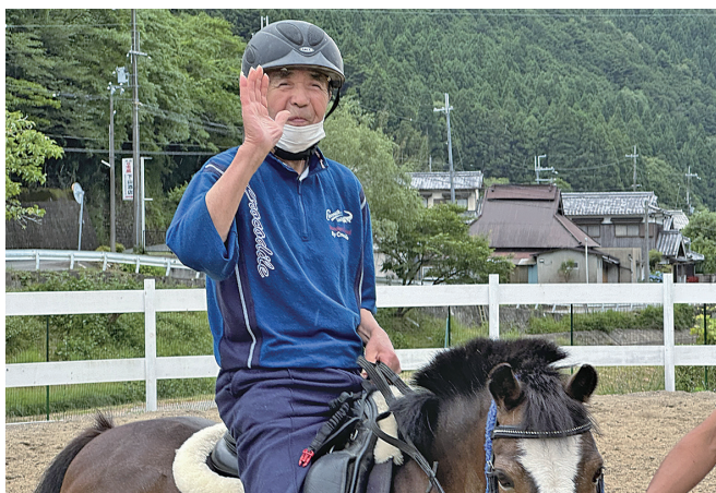
施設利用者様と弊社の乗馬クラブにて騎乗体験した際の様子です

から実践しています。介護ロボットやIHを他事業所にさきがけて導入し、業務効率を向上させることで、職員の業務負担をへらし、有給休暇取得100%を推奨し働きやすい環境を整えています。