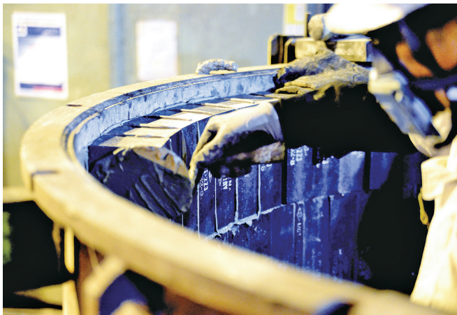
いまだに機械化できない貴重な技術職「築炉工」

変化のスピードの早い現在には、自らの失敗を認める勇気を持つことが明日への成功の近道と考え、「失敗を認める勇気を持とう」というスローガンを全社的に掲げ、「モノづくり」は「人づくり」、伝統と技術を受け継ぐ人材育成に力を入れています。