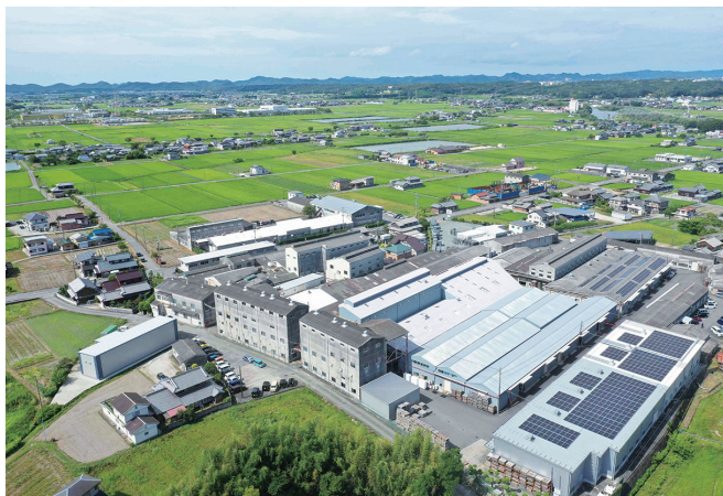
高品質・高付加価値の製品づくりを実現しています

また、多品種少量生産と「あらゆるサイズのあらゆる形状」を可能にする高度な技術開発力があり、当社のセールスポイントでもあります。