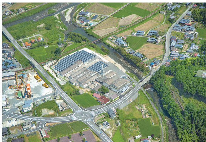
環境にやさしい本社工場です

としており、近年は電池材料の加工拡大を目指して各種新規設備の導入を積極的に行い、従業員一同一丸となって取り組んでおります。これからも社会のニーズに応え、長い伝統と蓄積した技術を活かして、新規分野に積極的にチャレンジしてまいります。