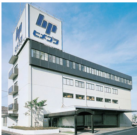
本社は姫路駅から徒歩約10分のところにあります

を開発・製造しています。2008年にはNET販売事業、2020年には海外販売事業をスタートし、ヒメプラならではの多彩な品揃えと、豊富な経験、機動力でお客様のご要望やこだわりにも対応しています。多くのお客様にご好評いただいております。