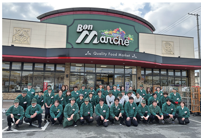
兵庫県南西部で創業68年を迎えるスーパー

世界各地の食文化をお客様にお届けするために尽力しています。クオリティの高い商品の提供を通じて、お客様に喜んでいただき、地域の食文化の発展に貢献していくことが私たちの大きな使命です。これからも地域に密着したサービスを展開していきます。