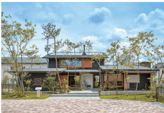
しそう杉の家モデルハウス外観

合わせ、年間約1,000件の工事を4事業所で施工。累積工事実績は25,000件を超えています。また、近年は「グッドデザイン賞」「ウッドデザイン賞」の受賞に加え、「日本エコハウス大賞」および「住まいの環境デザイン・アワード」においてそれぞれ優秀賞を獲得するなど、多くのコンテスト等でヤマヒロの住宅や取り組みに高い評価をいただいております。