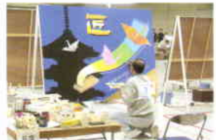
広告美術(ペイント仕上げ)