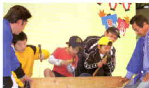
子どもたちも職人体験