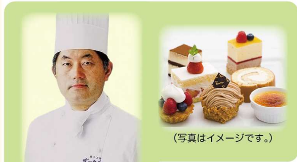
(写真はイメージです。)