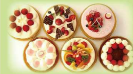
(写真はイメージです。)

フレッシュで甘い神戸産イチゴを使ったミルフィーユをはじめ、3種類のケーキを作ります。