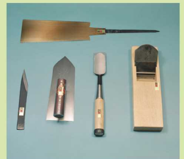
(写真はイメージです。)