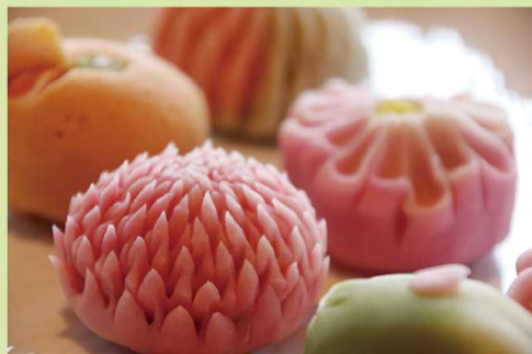
(写真はイメージです。)