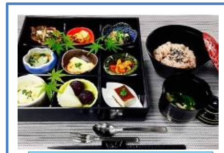
毎月1日の松花堂弁当など春夏秋冬を感じられる美味しい食事を提供