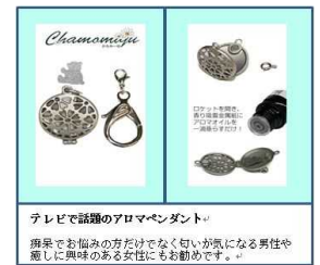
テレビで話題のアロマペンダント 病後でお悩みの方だけでなく匂いが気になる男性や 癒しに興味のある女性にもお勧めです。

多孔性金属紙と透かしロケットを組合せた癒しの道具「かもみーゆ」の開発。香料の残存性に優れたアクセサリーとして市場性に優れる。（第二創業）