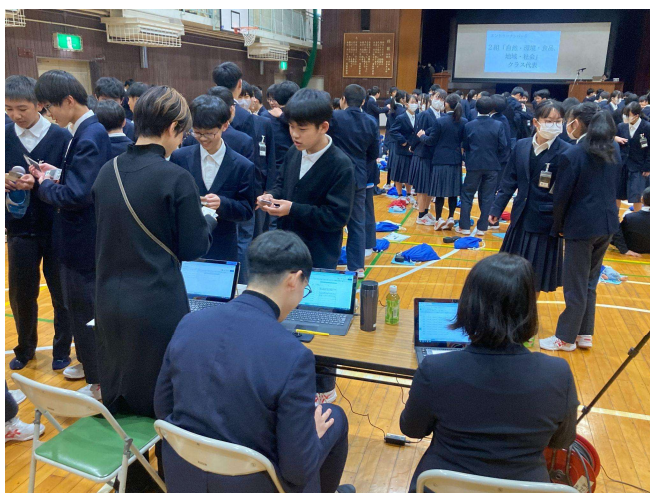
過去の類似プログラムの様子④（30名規模／茗溪学園中学校様にて）