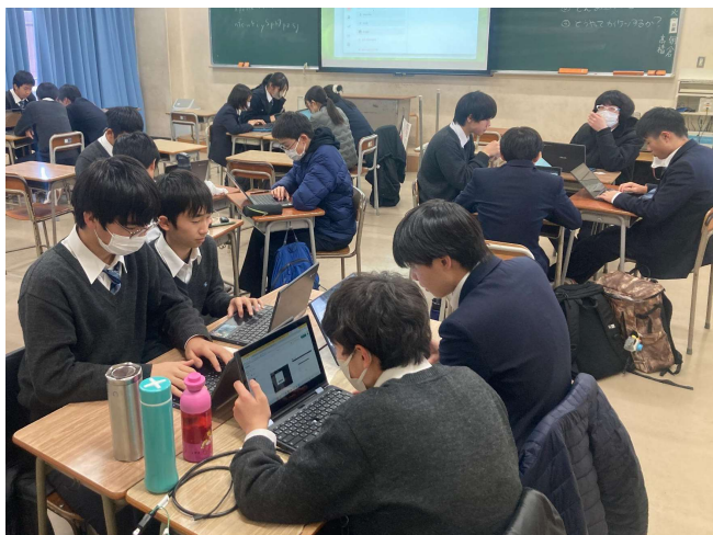
過去の類似プログラムの様子②（15名規模／茗溪学園中学校様にて）