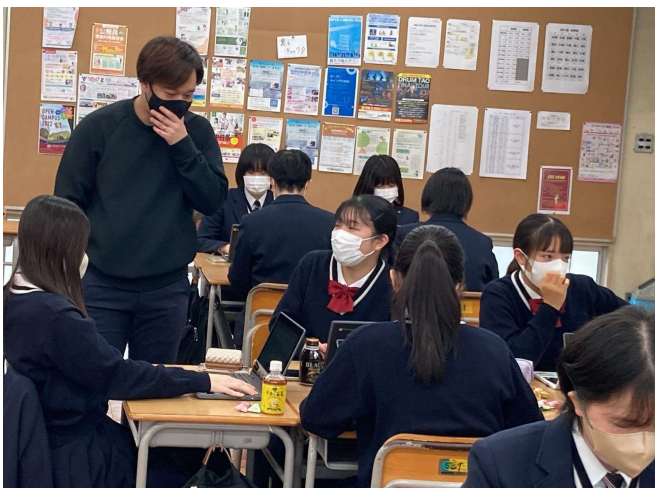
過去の類似プログラムの様子①（15名規模／早稲田大学系属早稲田実業学校様にて）