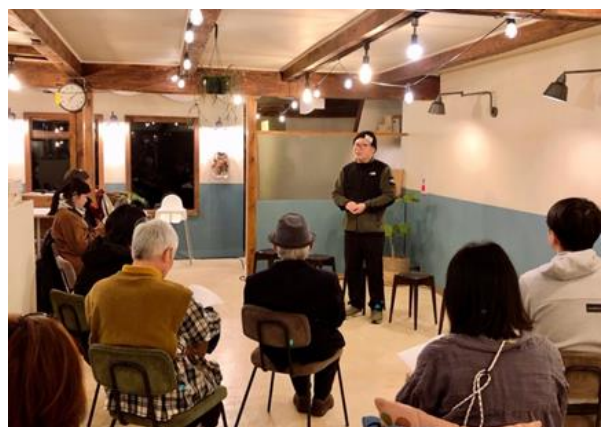
6年2月2日出石のカフェでナイトリーディング