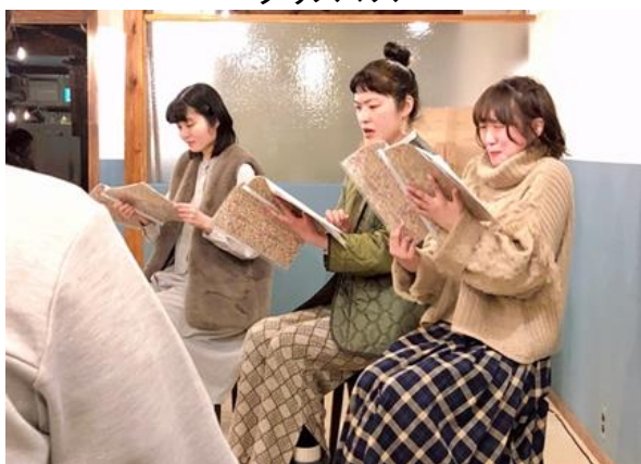
6年2月2日出石のカフェでナイトリーディング