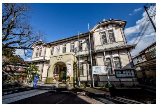
旧丹波市役所柏原支所庁舎外観

仮庁舎駐車場は、建物東側の駐車区画をご利用ください (道幅が狭くなっておりますので、ご注意ください)