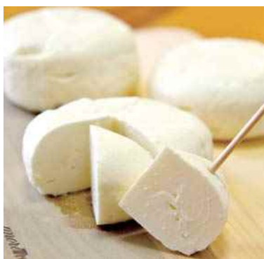
平成29年度 丹波婦木農場チーズ工房(丹波市) ナチュラルチーズサンマルセラン