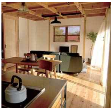
平成29年度 株式会社おいたて工務店(丹波篠山市) SETTE (企画住宅)