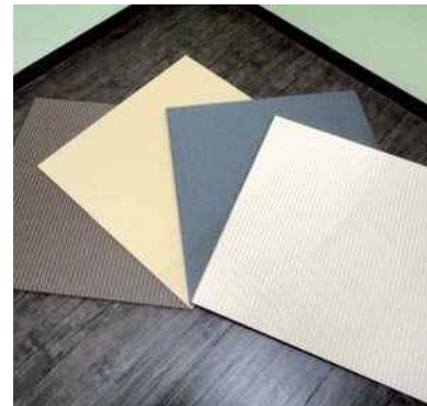
平成30年度 株式会社横谷(丹波市) フロアtatami