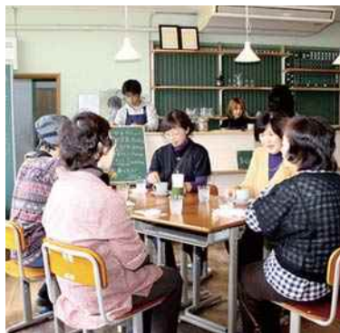
平成29年度 合同会社里山工房くもべ(丹波篠山市) 旧雲部小学校舎を活用した地域づくり