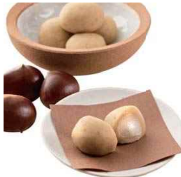
平成27年度 株式会社諏訪園(丹波篠山市) 丹波栗の風味・色合いを生かした「新栗もち」