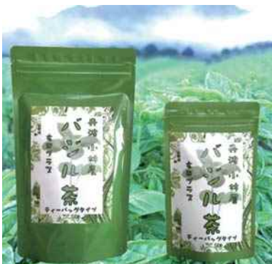
平成28年度 丹波小林屋(丹波市) バジル茶