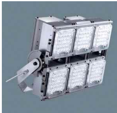
平成29年度 パナソニックライティングシステムズ株式会社 春日工場 (丹波市) LED投光器モジュールタイプ