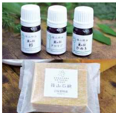
平成30年度 株式会社ささやまビーファーム(丹波篠山市) 篠山石鹸・篠山精油