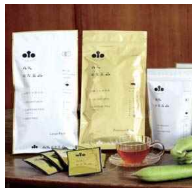
平成29年度 有限会社こやま園(丹波市) 丹波なた豆茶