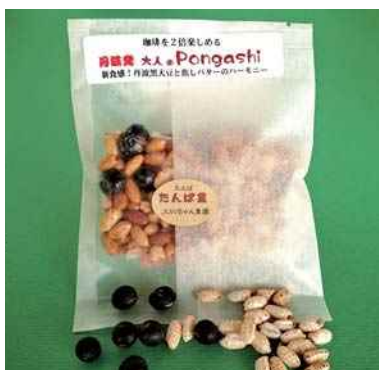
平成29年度 たんばJUNちゃん農園(丹波市) 丹波発大人のPongashi