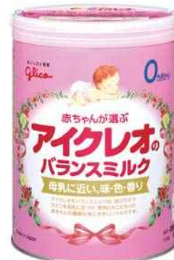
平成28年度 アイクレオ株式会社柏原工場(丹波市) アイクレオのバランスミルク