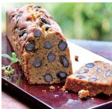
平成28年度 合同会社とあっせ(sasarai)(丹波篠山市) パティスリーバトン