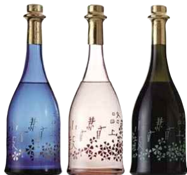
平成26年度 株式会社西山酒造場(丹波市) 通年楽しめるしぼりたての純米大吟醸酒「小鼓 路上有花シリーズ」