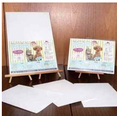
平成30年度 フォト・プランニング(丹波市) クリーンライフプロ