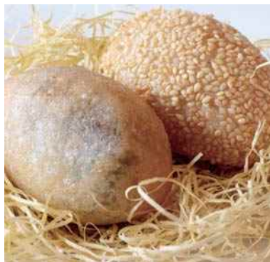
平成30年度 株式会社友縁/大連飯店(丹波市) 丹波ゴールドエッグ-栗- 丹波ドラゴンエッグ-黒ごま-