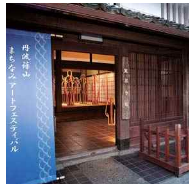
平成30年度 丹波篠山・まちなみアートフェスティバル 実行委員会(丹波篠山市) 丹波篠山まちなみアートフェスティバル