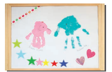
ママの動き方応援隊「手形アート作り」

西播磨地域で活動している団体が出展します。 こんな取組みがあるんだ!など情報が盛りだくさん。 見るだけでなく体験ができるブースもあるのでぜひ お立ち寄りください。