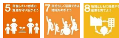
西播磨地域ビジョン 2050 取組目標