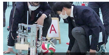
高校生によるロボットの展示や実演も！ (兵庫県高等学校教育研究会工業部会)