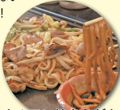
ホルモン焼きうどん