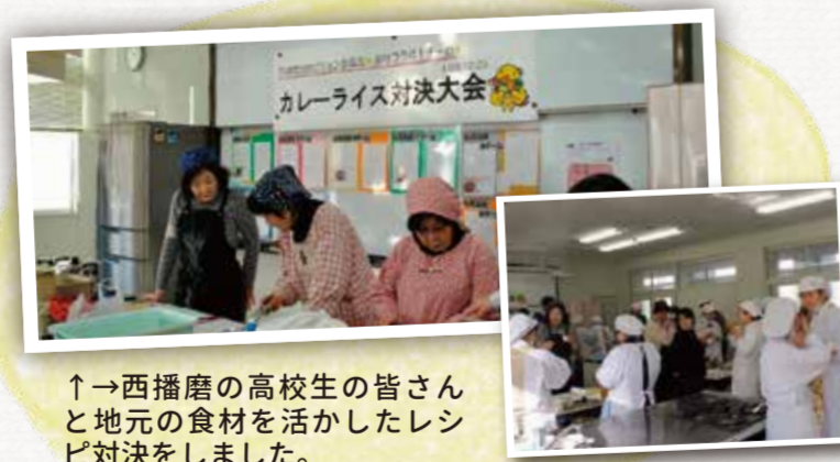
↑西播磨の高校生の皆さんと地元の食材を活かしたレシピ対決をしました。

第7期西播磨地域ビジョン委員会西播磨食材コラボ! チームの2年間の活動の足跡として、皆様にご覧いただけたら嬉しいです。