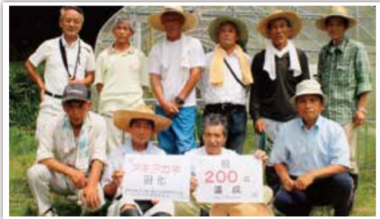
たつの赤とんぼ米研究会

全国的に激減した赤トンボの代表種・アキアカネを復活させる為、彼らが育つ農法を8年かけて開発した。殺虫殺菌剤に影響の少ないものに代え、約2カ月間水を切らさないようにし、実際にヤゴを羽化させている。