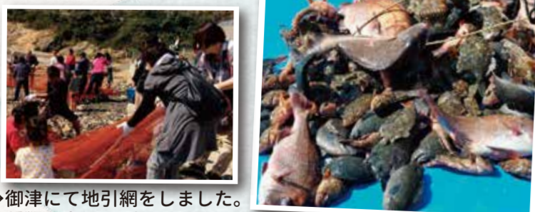
→御津にて地引網をしました。種類の多さにびっくり!