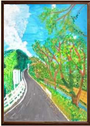
【小学校高学年の部】