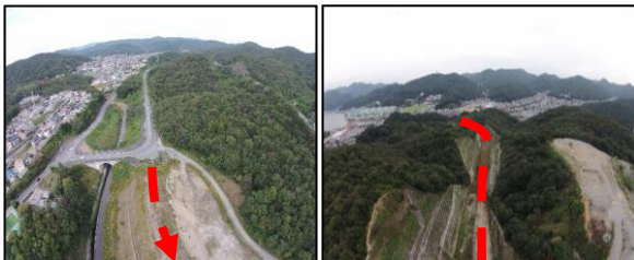
竜泉那波線 (道路新設工事)