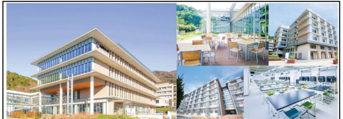
兵庫県立大学 姫路工学キャンパス