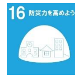
【西播磨地域ビジョン 2050 取組目標】