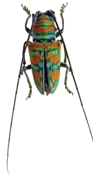
ホウセキカマキリ