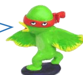
美術館の妖精 イベチャン