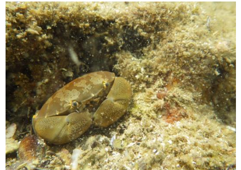
潮間帯の潮溜りに潜むスベマンゾウガニ