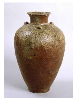
たんばきっかもんさんじこ 丹波菊花文三耳壺 (個人蔵 愛知県陶磁美術館寄託) 重要文化財

本展では、その調査成果をふまえて、影響を受けたと思われる他地域産のやきものも紹介しながら、丹波焼の成立について考えます。