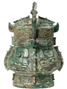
獣面紋卣(じゅうめんもんゆう) 【商時代後期】

本展では、商(殷)から西周時代の青銅器の中から、儀礼の中心となる伝統的な酒器、食器を展示し、形態的变化や青銅器に表れる思想などを紹介します。