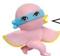
美術館のようせい イントちゃん