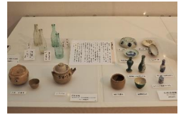
近代の出土品 汽車茶瓶や牛乳瓶なども

本展では、兵庫津周辺で行われた発掘調査の出土品から、中世～近世の兵庫津の歴史をたどります。