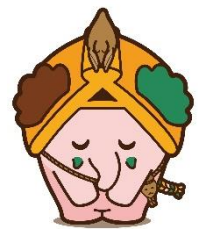
当館のマスコットキャラクター “ほったん”です