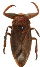
タガメ (30年後も残したい兵庫の希少昆虫)