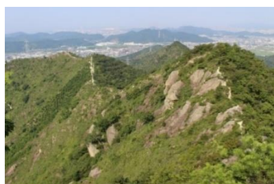
播磨のはげ山・岩山 (30年後も残したい兵庫の風景)