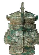
獸面紋卣(じゅうめんもんゆう) 【商時代後期】