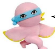
美術館のようせい ントチャン