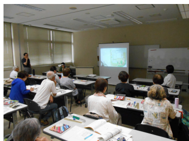
庭園デザイン演習(7月)