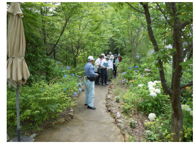
先輩ガーデナー実践地見学(7月)