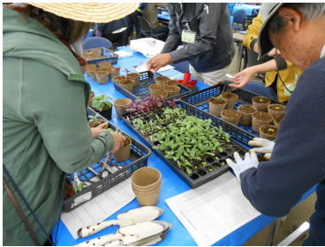
ポット植え付け(5月)

※(時間割)水:3-4限,木:1-4限,金:1-3限(7.9月のみ1-2限) ※見学時の昼食代、実習材料費等別途要