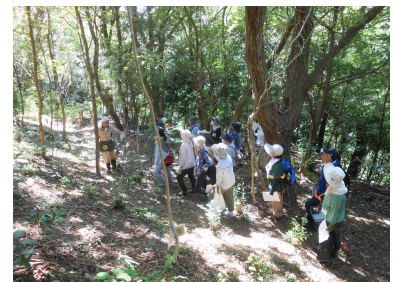
里山管理の実践(9月)