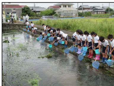
ため池や水路で生き物を捕獲