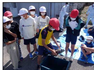
捕獲した生き物に触れ観察