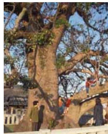
境内の大クス