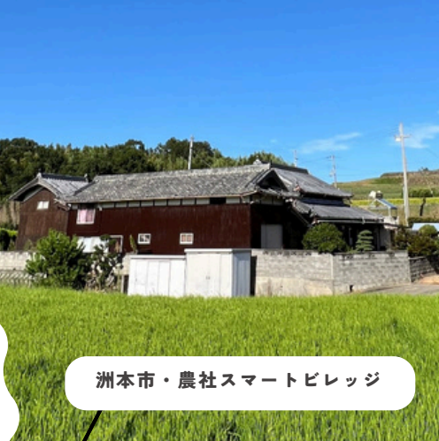
洲本市・農社スマートビレッジ