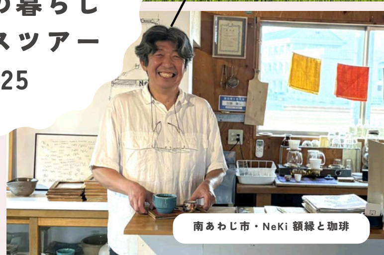
南あわじ市・NeKi 額縁と珈琲