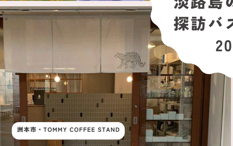
洲本市・TOMMY COFFEE STAND