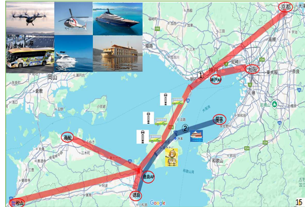
関西エリア・瀬戸内エリアの結節点(淡路島)イメージ