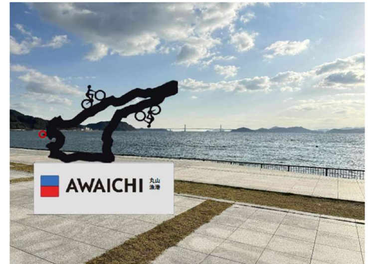
【フотスポット設置イメージ】