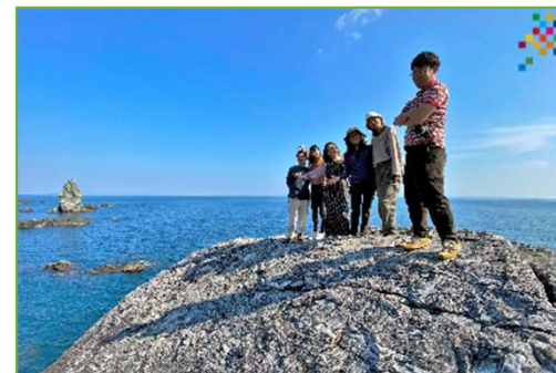
【地元民も知らないスポット巡り: 沼島編】