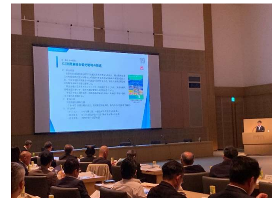
【あわじ環境未来島構想推進協議会総会】