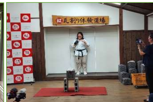
【富裕層インバウンドAGT招聘 (アジア向けFAMトリップ)】