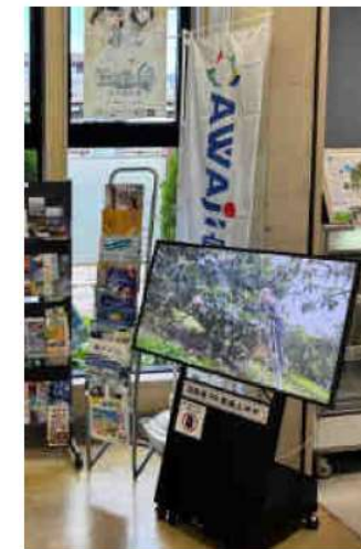
サイネージ設置 (洲本BC)