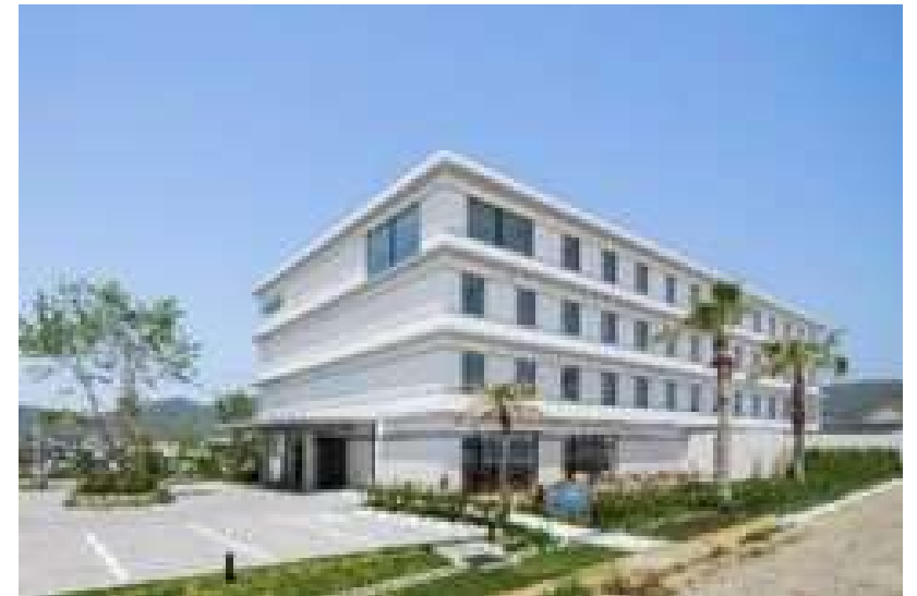
【フェアフィールド・バイ・マリオット 兵庫淡路島東浦】

東浦地区において、ホテル関係者との意見交換を実施し、現状や関係者が抱える課題を共有する予定