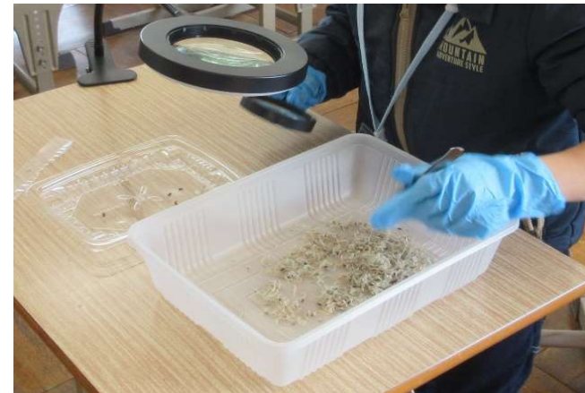
令和6年度に実施した体験ツアーの様子 (ちりめんじゃこの選別体験)