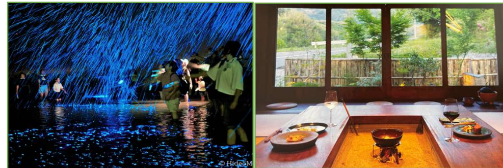
【「海ホテルショー」&古民家で味わう地産地消にこだわった食事と癒しの宿泊】