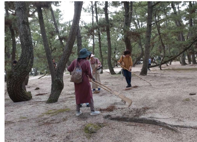
【令和6年度に実施した清掃活動の様子】