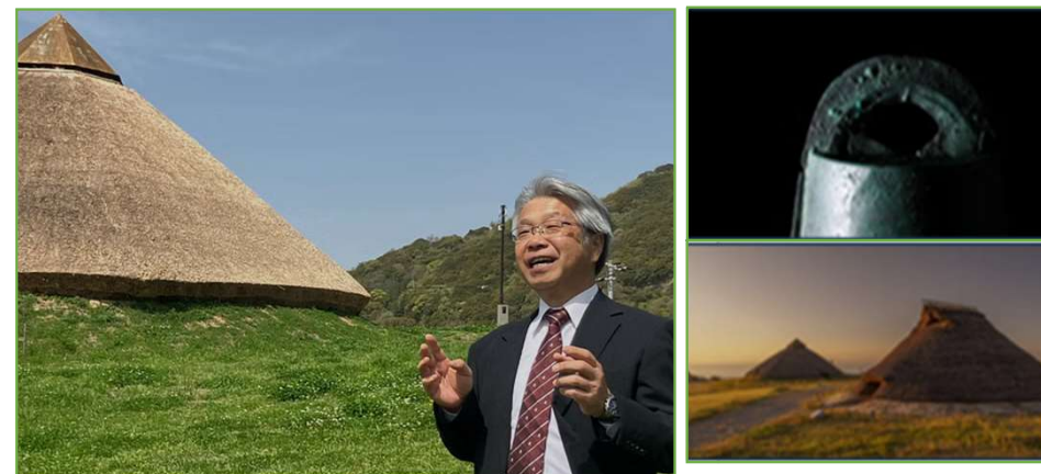
【淡路島の古代歴史の謎をたどるツアー(造成中)】