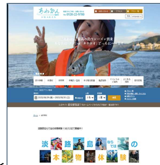
【宿泊施設(あわかん)×本物体験プラン】