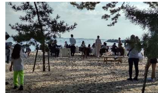
【海辺のあさいち・あさごはん】