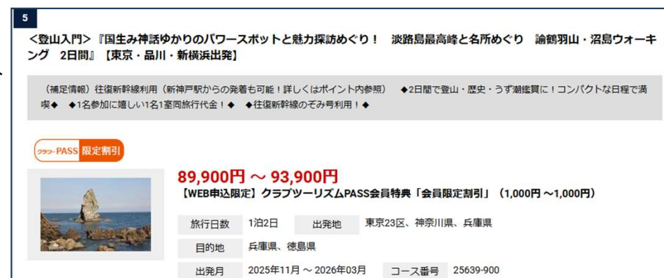
【クラブツーリズムツアー (国生み神話ゆかりのスポット巡り旅)】