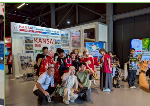
【大阪・関西万博会場 淡路島PRブース (フェスティバル・ステーション内)】