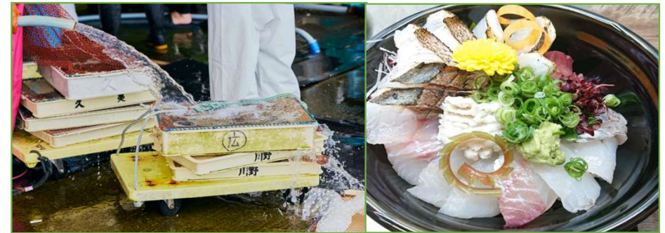
【由良漁協セリ見学後、由良の一本釣り魚ランチ】