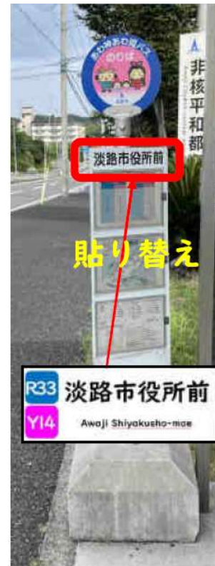
バス停標柱の 改修イメージ