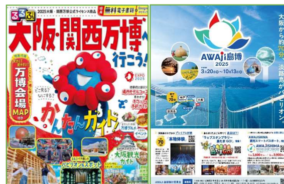
【るるぶ万博:裏表紙裏面】