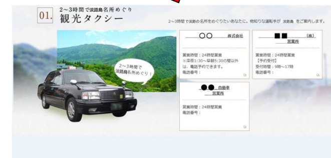
【タクシー予約ページへの誘導例】