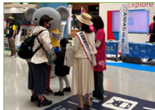
【関西国際空港1F到着ロビー】