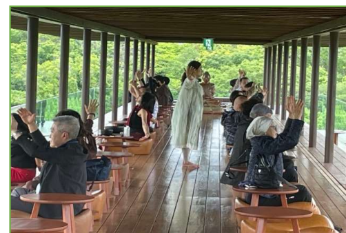
【シンガポール富裕層旅行者 (禅坊靖寧)】