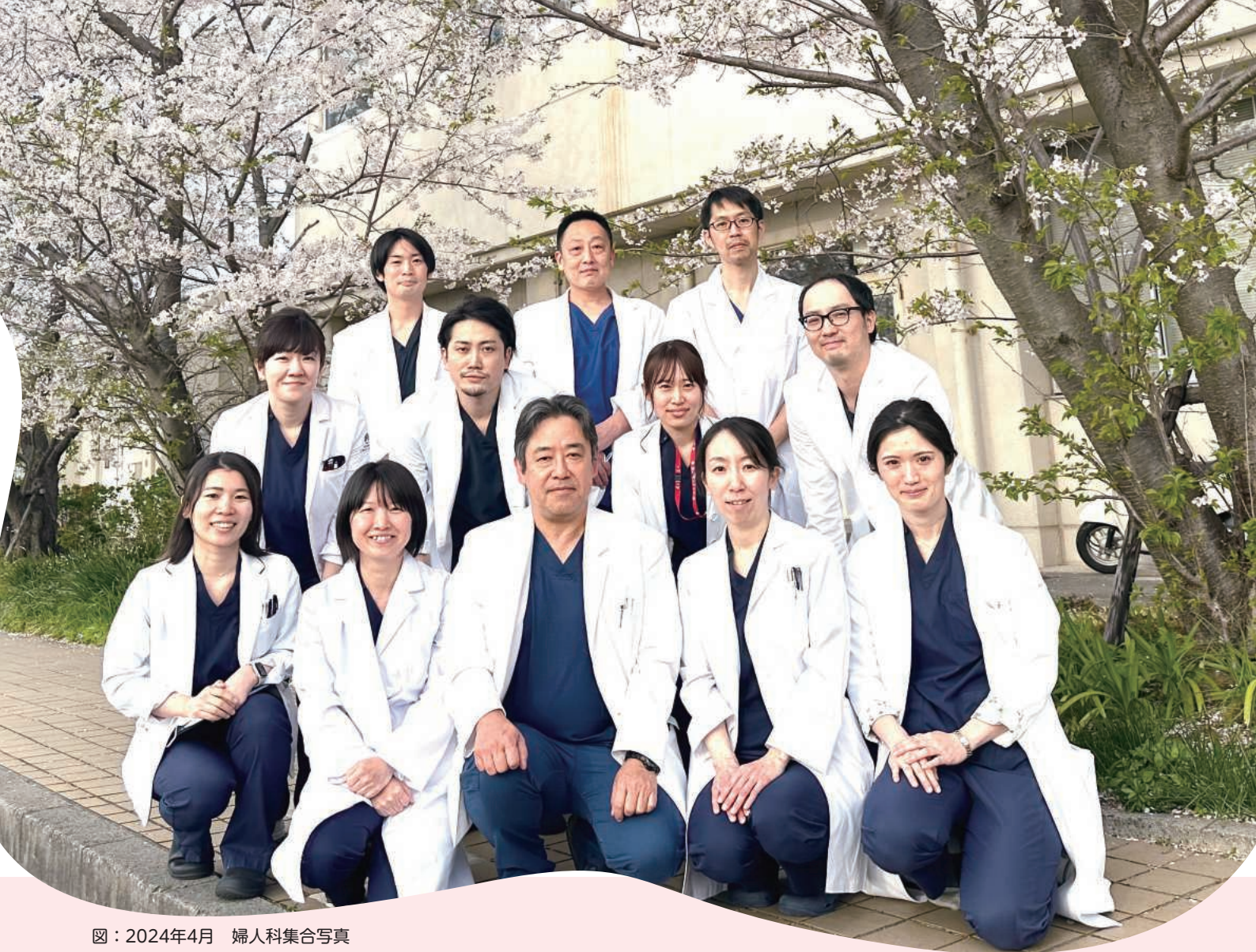
図：2024年4月 婦人科集合写真

バシズマブ)との併用療法として「進行又は再発の子宮頸癌」に対して承認されました。従来の治療法にペムブロリズマブを上乗せすることで全生存期間の延長が示され、患者さんにとって大きなメリットになる可能性があります(図)。さらに2022年12月に同じく抗PD-1抗体であるセンプリマブが「癌化学療法後に増悪した進行または再発の子宮頸癌」に対して承認されました。当院での使用経験も増加してきています。