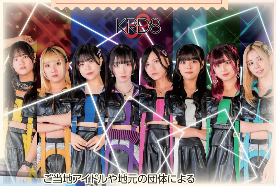
ご当地アイドルや地元の団体による ステージ演奏 など (8団体程度)

～播但貫く、銀の馬車道 鉱石の道～ 銀の馬車道ウォーク ● 参加費無料 ● 事前申込不要