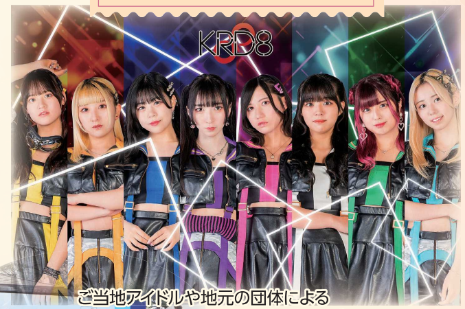
ご当地アイドルや地元の団体による ステージ演奏 など (8団体程度)