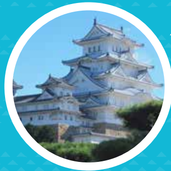
2015年3月、姫路城 グランドオープン!