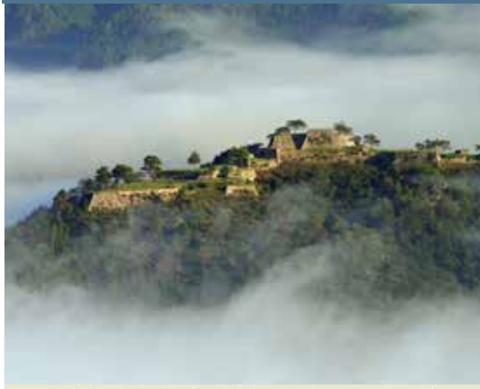
竹田城跡