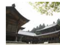
三つの堂 大講堂・食堂・常行堂の3つの国指定重要文化財がコの字型に並んでいます。修行体験の座禅は常行堂、写経は食堂で行われます。

健康道場(月に1回開催) 8:00~翌日16:30/12,000円 一日修行体験(健康道場に併せて開催) 10:00~17:00/5,000円 坐禅(概ね毎日)14:00~/500円 すべて要予約。申し込みは圓教寺本坊 ☎079-266-3327 詳しくはhttp://www.shosha.or.jp/ ●姫路市書写2968 ☎079-266-3327 8:30~17:00/無休/志納金500円 ※12月に定期点検のためロープウェイの運休あり(約1週間)