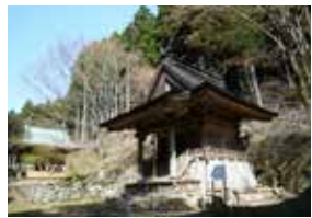
笠形神社 約1300年前に創建されたと伝えられる古刹。参道周辺には杉の巨木が見られます。 ●市川町観光協会 ☎0790-26-0099