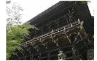
摩尼殿 岩山の中腹に立つ舞台づくりの建物。 1月18日の鬼追いもここで行われます。