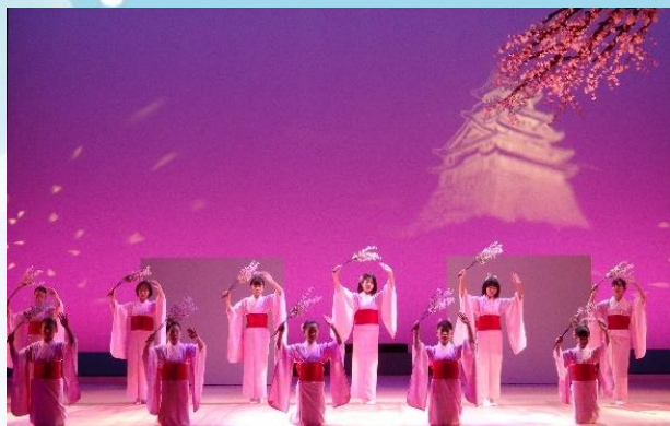
成果発表風景（昨年度）