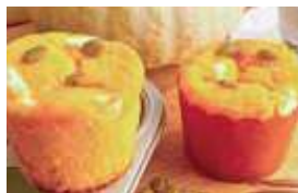
銀馬車かぼちゃと クリームチーズのマフィン