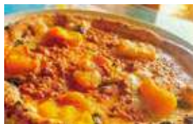
銀馬車かぼちゃの 美味しいナポリピッツァ