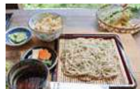
銀馬車かぼちゃの天ぷら