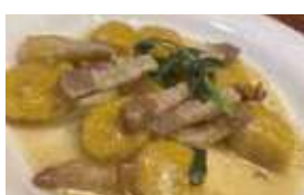
銀馬車かぼちゃのニョッキ 自家製ベーコンの セージバターソース