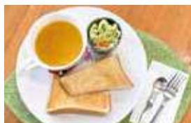
銀馬車かぼちゃスープの トーストセット【金・土・日限定】