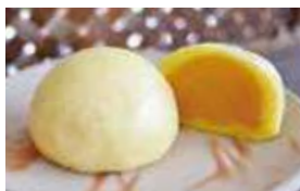
銀馬車かぼちゃの 蒸しまんじゅう