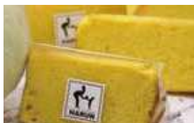
銀馬車かぼちゃのシフォン