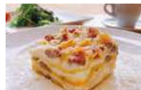
銀馬車かぼちゃと イタリアンソーセージの ふわとろラザニア