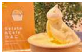
銀馬車かぼちゃのジェラート

シングル(一種類盛り) 450円(税込) ダブル(二種類盛り) 600円(税込) トリプル(三種類盛り) 700円(税込)