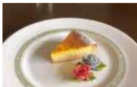
鶴 imo と 銀馬車かぼちゃのタルト