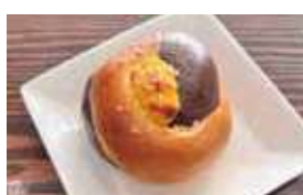
パンプキンチーズケーキ ベーグル