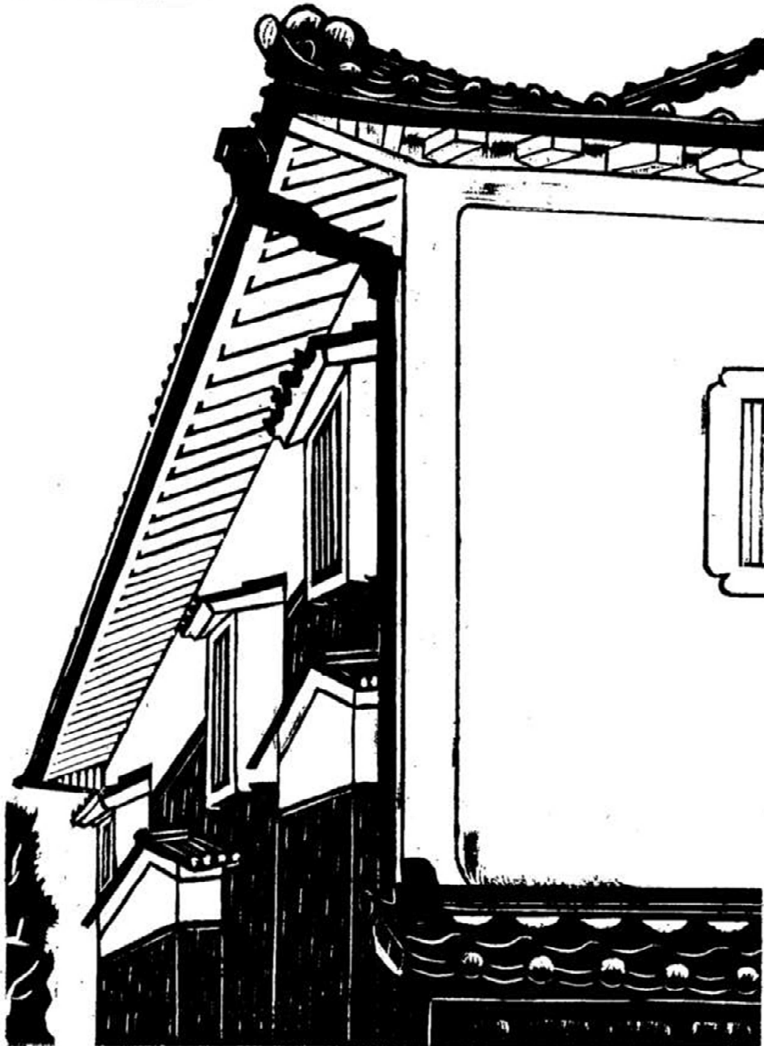
2010.10.7 古民家の裏小路