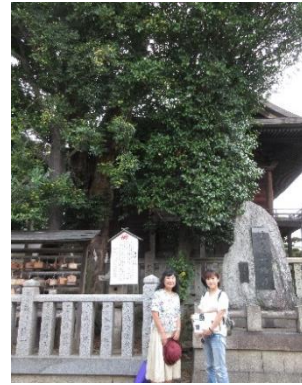
竹柏と司馬遼太郎文学碑